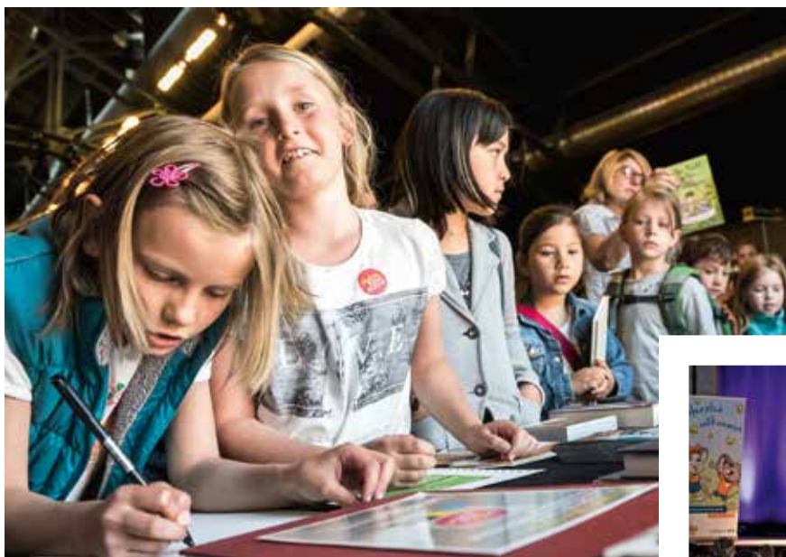
Die Lesungen an verschiedenen Orten in der Darmstädter Innenstadt richten sich an Jugendliche und Kinder zwischen 5 und 17 Jahren.