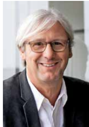
Jochen Partsch Oberbürgermeister