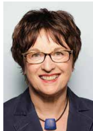
Brigitte Zypries Bundestagsabgeordnete