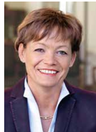
Lucia Puttrich Ministerin für Bundes- und Europaangelegenheiten