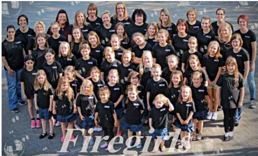
Die Tanzsportgruppe mit ihren vielen Facetten.