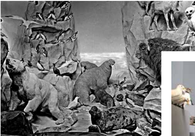
links: vor 1944 rechts: Arktis- Diorama in den 1970er Jahren.