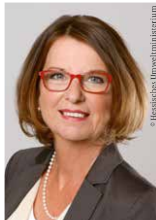
Priska Hinz Ministerin für Umwelt, Klima- schutz, Landwirtschaft und Verbraucherschutz in Hessen