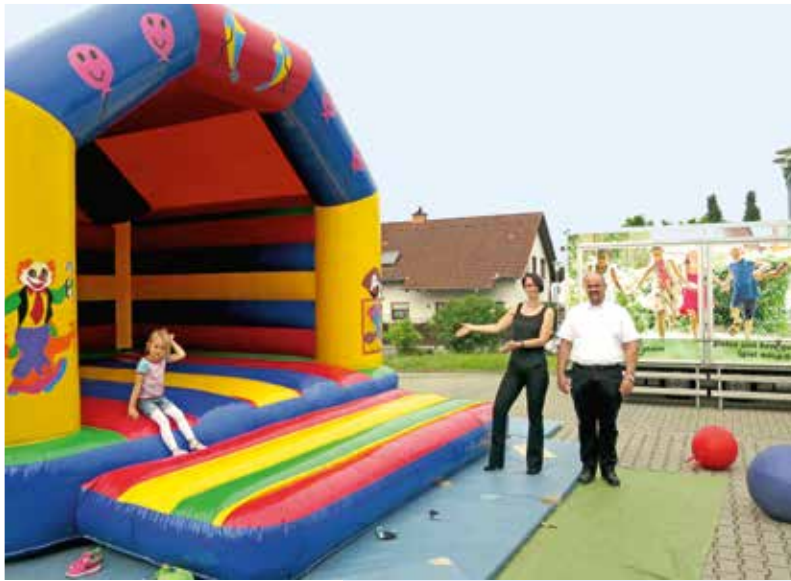
Anhänger mit Spielgeräten bestückt. Attraktion ist die Hüpfburg.