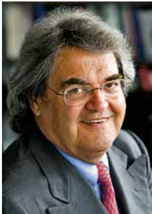
Helmut Markwort Herausgeber des Nachrichtenmagazins „Focus“