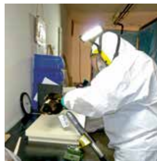
Arbeiten zum Neuaufbau.